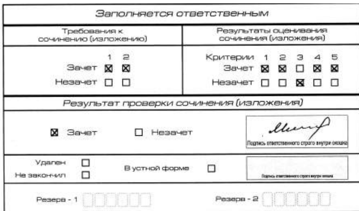
Рис. 10. Область для оценки работы

3. Во всех остальных случаях итоговое сочинение (изложение) проверяется по всем пяти критериям и оценивается по системе «зачет»/«незачет».