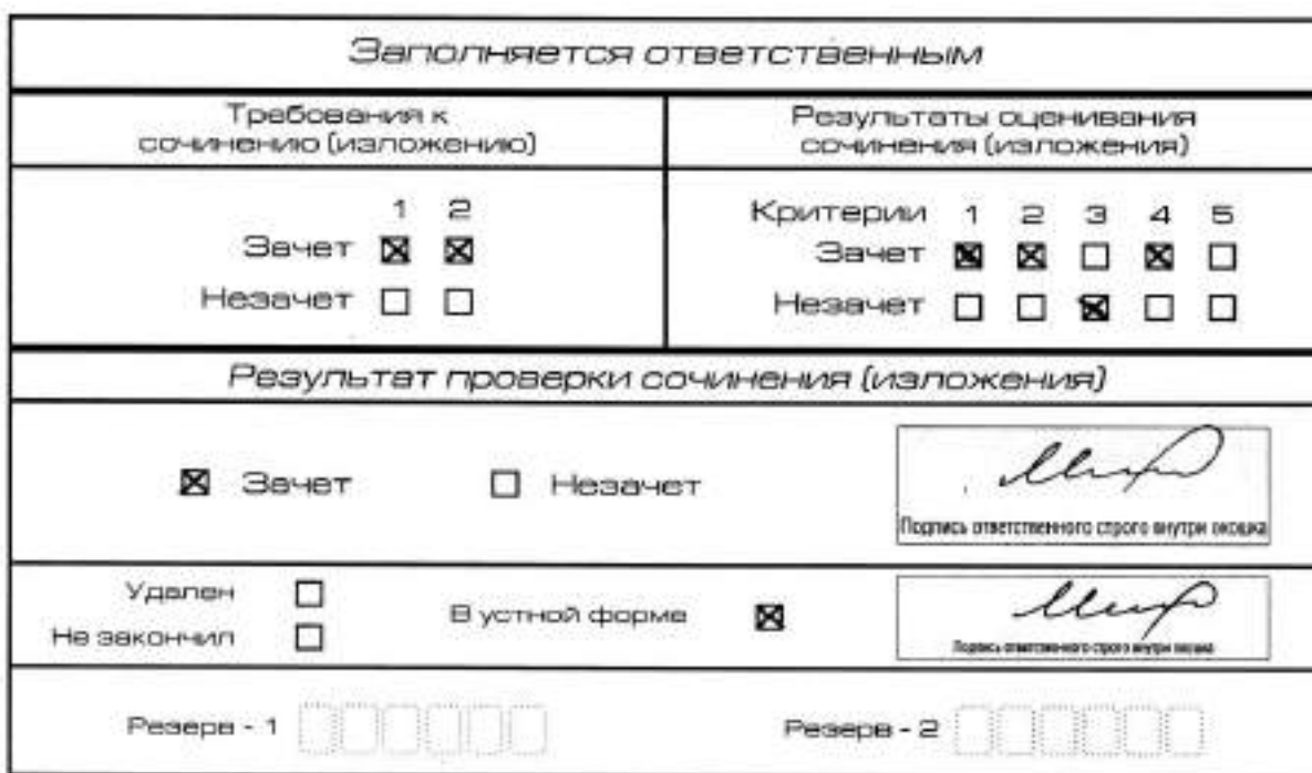
Рис. 11. Область для оценки работы сочинения (изложения) в устной форме

После окончания заполнения бланка регистрации ответственное лицо ставит свою подпись в специально отведенном для этого поле.