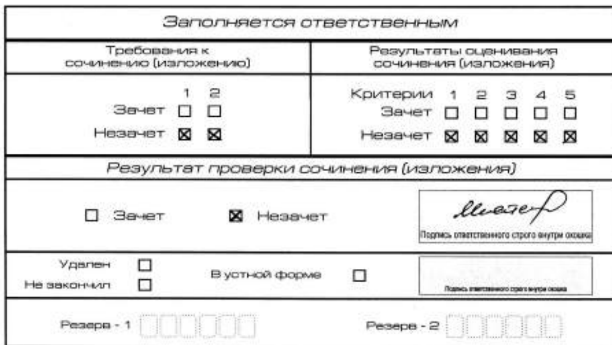
Рис. 8. Область для оценки работы