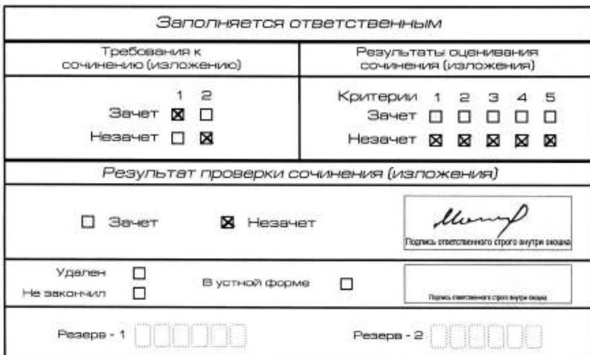
Рис. 9. Область для оценки работы

Если итоговое сочинение (изложение) соответствует требованию № 1 и требованию № 2, то выставляется «зачет» за выполнение требования № 1 и требования № 2. Указанные сочинения (изложения) далее оцениваются по критериям.